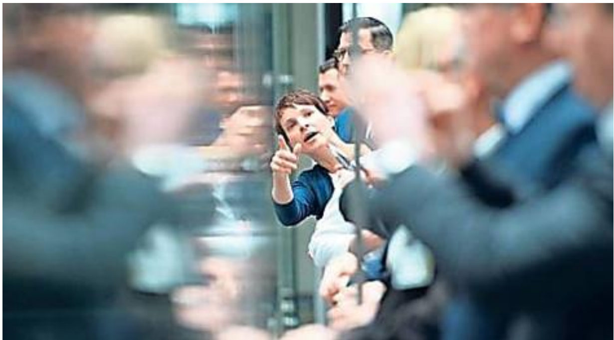
Streit um Sitzordnung